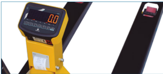
Transpaleta ARXLED Wide (para palés americanos)