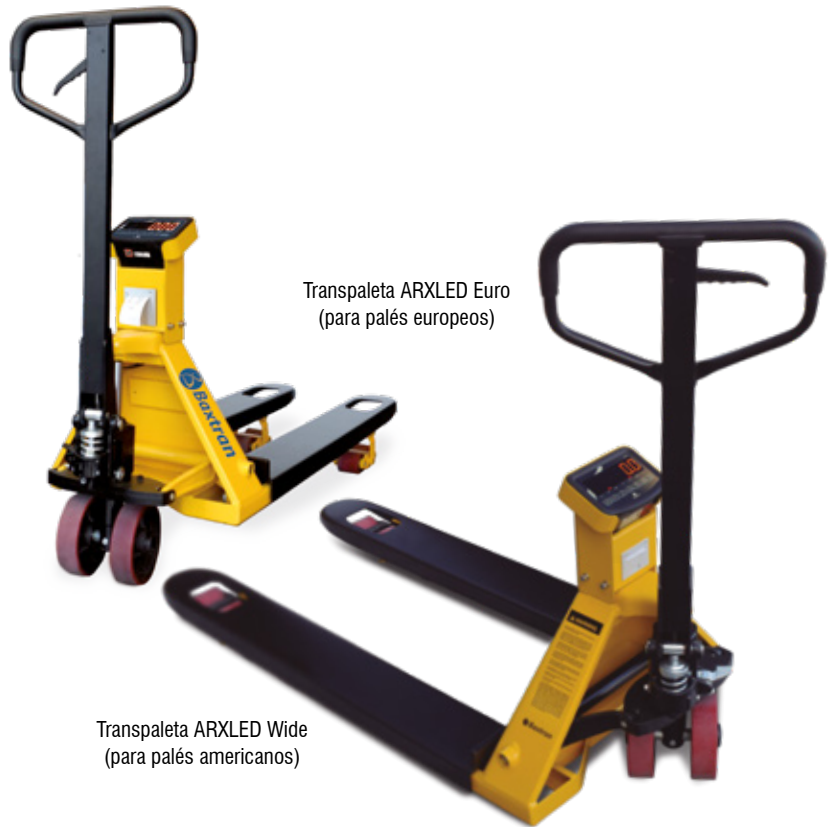
Transpaleta ARXLED Euro (para palés europeos)